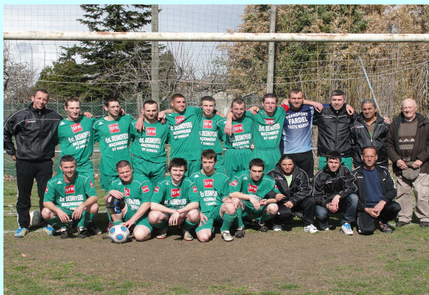
AS Mosnac/Champmillon 2012/2013

Tous les matchs de coupe auront lieu sur le terrain de Mosnac, mais les dates ne sont pas encore connues.